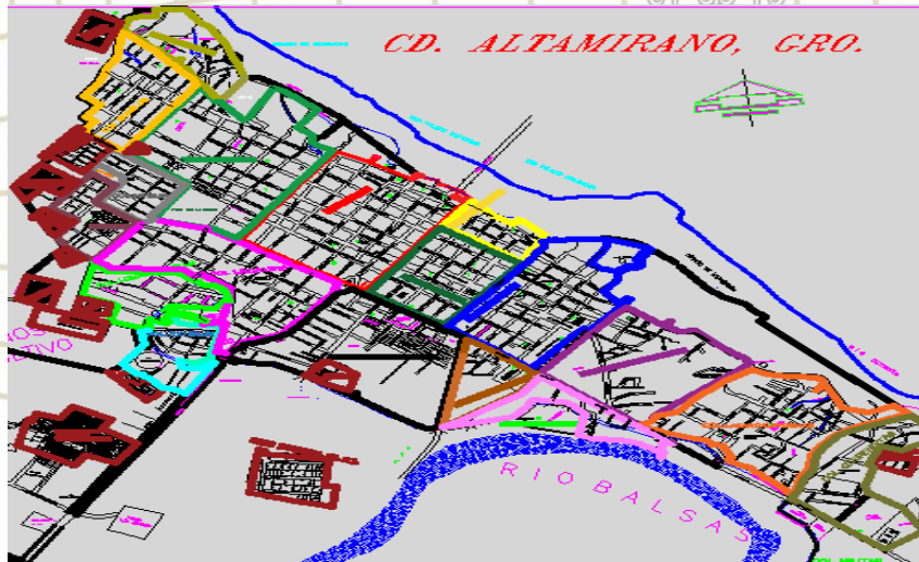
Imagen: Colonias y fracciones de la Zona 01-pungarabato, fuente: Dirección de Catastro SECTOR CATASTRAL 000